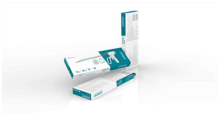
오토 클립 어플라이어 (패키지/팜플렛디자인)