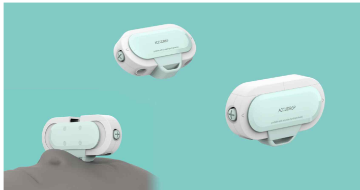
점안액 보조장치 (제품디자인/시제품제작)