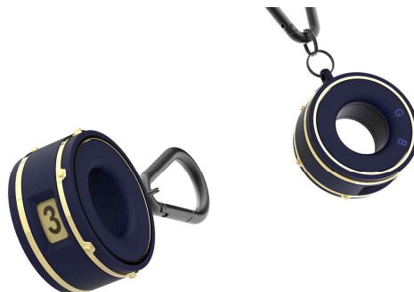
기억 키링 (제품디자인/시제품제작)